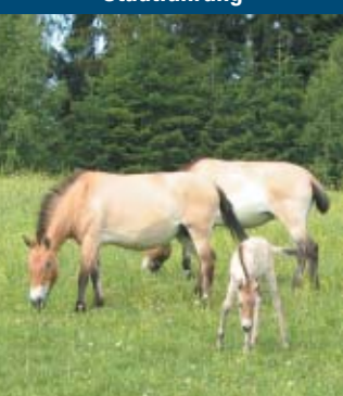
Wildpferde/Haus zur Wildnis